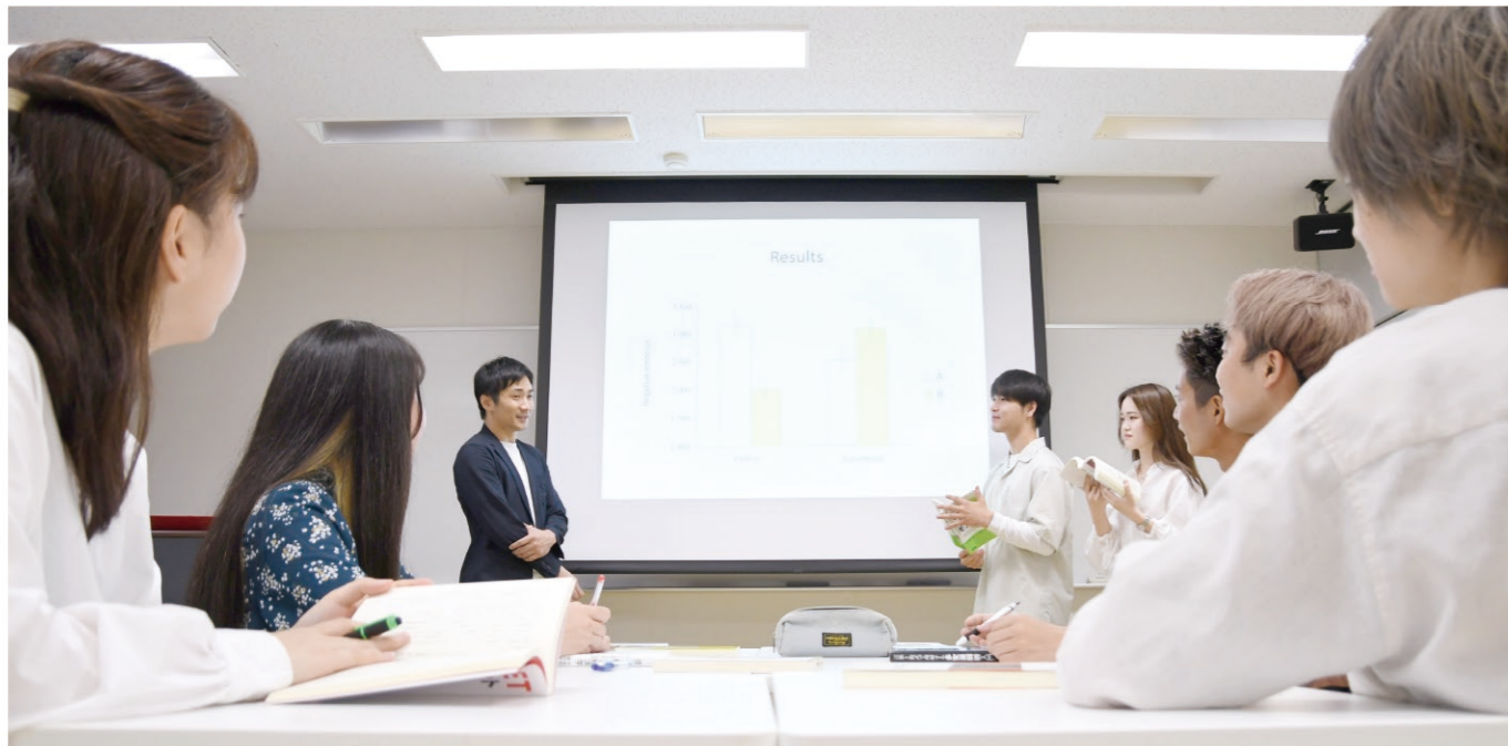
※新型コロナウイルス感染拡大状況においては、マスク着用や座席間隔の確保、教室の消毒などの感染予防対策を取りながら授業を行っています。

心理学コースでは、心理学の基礎から応用まで、幅広くかつ専門的に学びます。人間の心と行動を科学的に理解するための基礎的知識を身につけ、そこからさらに心の健康に関する実践的スキルや消費者心理などの実用的スキルを修得するカリキュラムが用意されています。人間の心と行動への深い理解に基づき、地域の様々な心理的問題の解決に貢献できる人材と、産業やビジネスに心理学的側面から貢献できる人材の育成を目指します。また、公認心理師受験資格を得られる教育体制・カリキュラムを整えています。