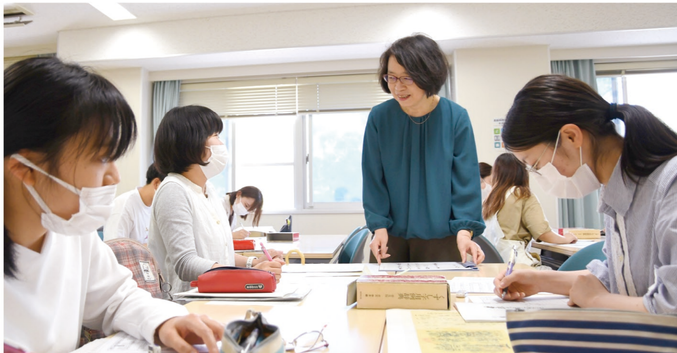
※新型コロナウイルス感染拡大状況においては、マスク着用や座席間隔の確保、教室の消毒などの感染予防対策を取りながら授業を行っています。

多元地域文化コースでは、メディア・現代文化から、世界の諸地域に関する思想・文学・文化・歴史・環境まで、幅広く学ぶことができます。人文学の基礎知識やスキルをバランスよく学ぶことができ、さらに自分の興味に沿った専門的な知識を習得できます。広い知識と深い専門性を活かし、人間社会の様々な事象を多面的に捉えられる分析力を身につけ、グローバル化や地域の抱える諸問題に対して自ら対応できる人材を育成します。