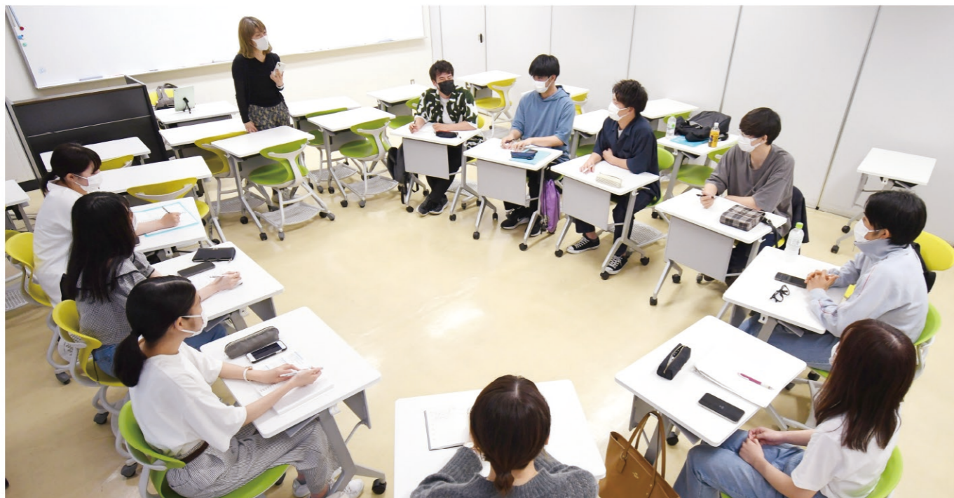
※新型コロナウイルス感染拡大状況においては、マスク着用や座席間隔の確保、教室の消毒などの感染予防対策を取りながら授業を行っています。

地域社会コースでは、コミュニティの観点から社会学・社会教育学を中心に地域社会の現状と課題を学び、地域社会が抱えるさまざまな課題を住民参画による協働形成によって解決できる人材を育てます。地域づくりの基礎であるコミュニケーション能力、地域社会の住民の視点からその課題や可能性を発見する能力、住民相互や行政など地域の組織団体との協働に必要なコーディネーターとしての能力を身につけることができます。