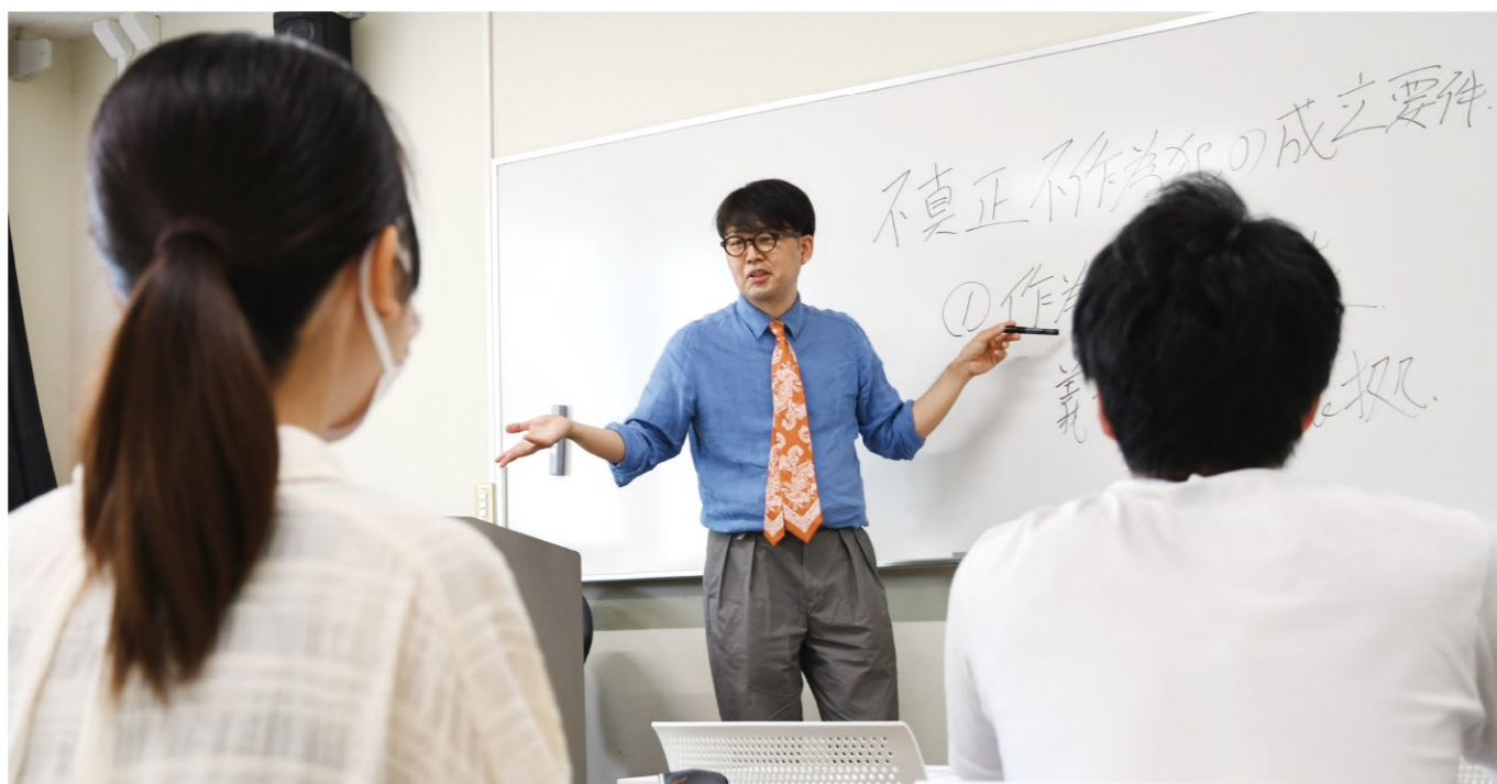
※新型コロナウイルス感染拡大状況においては、マスク着用や座席間隔の確保、教室の消毒などの感染予防対策を取りながら授業を行っています。

法学コースでは、法学・政治学に関する知識、論理的・科学的思考力と実践的な判断力、自らの考えを他者に伝える表現力を身につけます。これによって、地域社会や国際社会が置かれた諸状況の中から解決すべき課題を発見し、多様な考えや視点を踏まえつつ適切に解決するためのファシリテーション能力を有する人材を育成します。