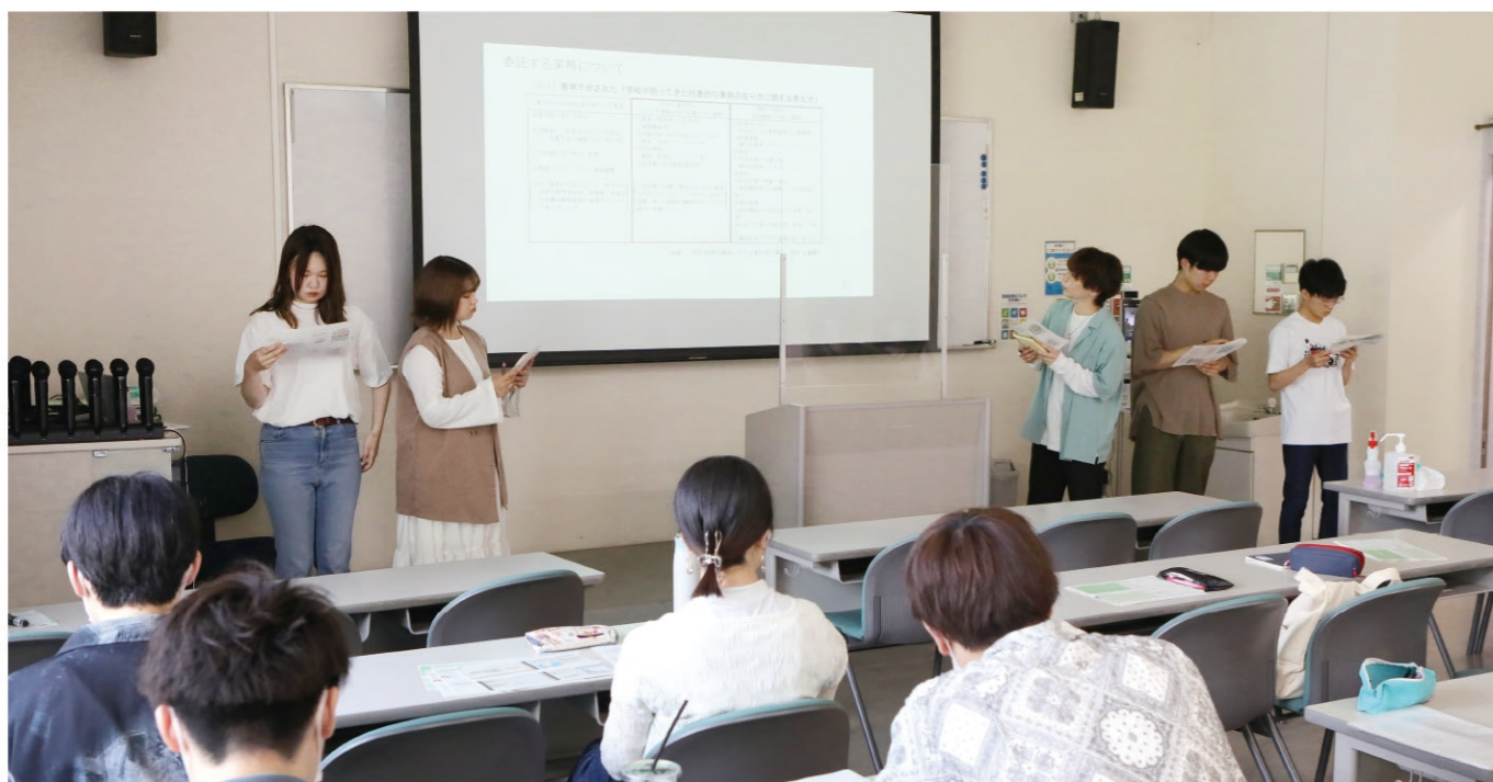
※新型コロナウイルス感染拡大状況においては、マスク着用や座席間隔の確保、教室の消毒などの感染予防対策を取りながら授業を行っています。

経済コースでは、地域レベルと国際レベルで経済・経営・情報の諸情勢が激動する中、そのダイナミズムを解明し実践の対応策を提示する知的パフォーマンスの発揮能力を育てます。そのために、基礎的な経済理論の修得、現実的な経済・経営情報に基づく科学的知見の生産方法、そして進化する情報システムの理解と活用を重視した教育課程が用意されています。そこでの学究は、教員そして学友との交流を通じて充実されます。